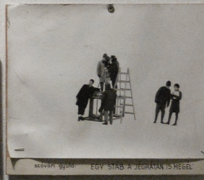
szabóvári gyula EGY STAB A JEGHÁTÁN IS MEGEL